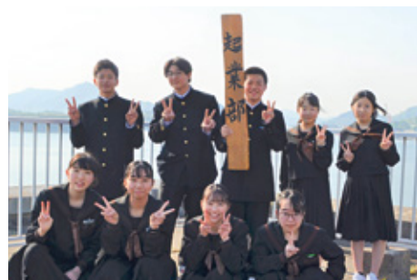
離島 うみ 挑戦