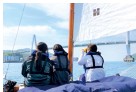
体験 地域 創造