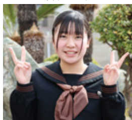
2021年度卒業 愛媛大学 教育学部 Sさん