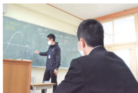
弓削 少数 学び

どこからでも海が見える校舎内には、和やかであたたかな雰囲気が流れています。一人一人が主役の学校行事、ICT機器を活用した体験型授業、地域とタイアップした様々な行事の企画など弓削高校だからこそできる挑戦がたくさんあります。